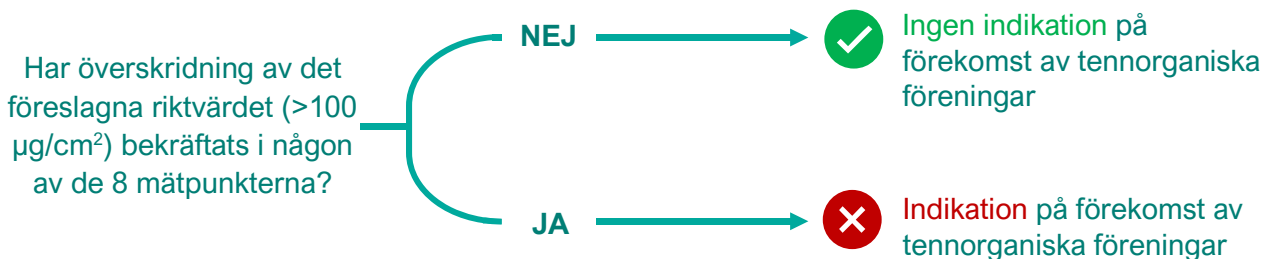
Figur 3 Beslutsdiagram för samlad bedömning av XRF-uppmätta tennhalter på ett skrov.