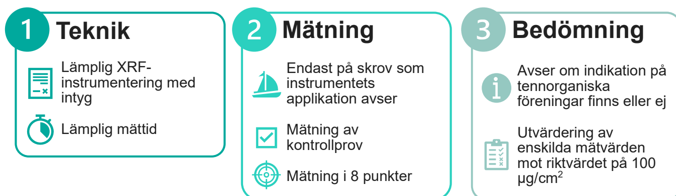
Figur 1 Schematisk översikt av förfarandet vid XRF-mätning och bedömning av tennhalter på fritidsbåtsskrov.

En mer utförlig beskrivning och redovisning av hur rekommendationerna tagits fram finns att läsa i rapporten "Kvalitetssäkring av XRF-mätningar av tenn på fritidsbåtar - För en harmoniserad och likvärdig bedömning av tennhalter på fritidsbåtar" .